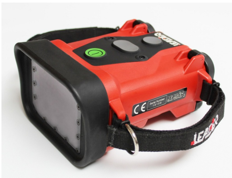
Kompakt & handlich - das zeichnet die neue Generation der Wärmebildkameras aus.

In den letzten Wochen wurden die Kameraden der Wehr auf die neuen Einsatzgeräte geschult. Somit können die Kameras sofort eingesetzt werden.