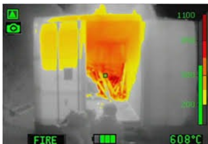
Die verschiedenen Modi der Kamera ermöglichen eine Vielzahl von Einsatzmöglichkeiten.