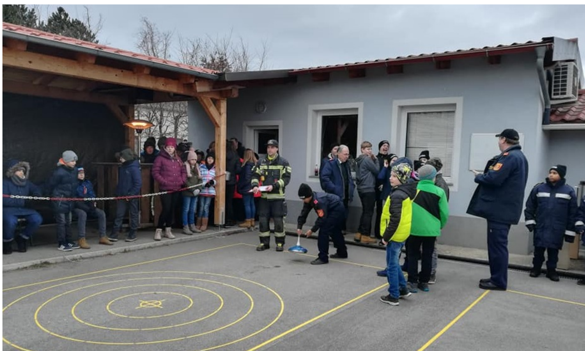
11 Gruppen aus dem Bezirk Baden traten an, um sich im Stockschießen zu messen.

Gleich zu Beginn des neuen Jahres wurde Anfang Jänner von der FF-Mitterndorf der Stockschießbewerb für die Feuerwehrjugend des Bezirks Baden am Sportplatz in Mitterndorf abgehalten.