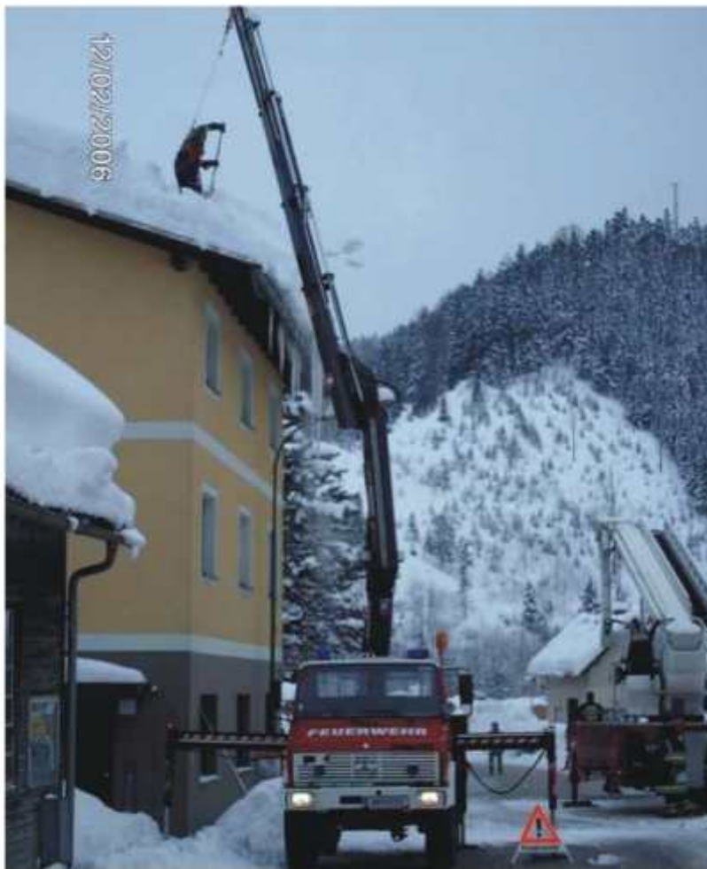
Troll H. beim Räumen eines Daches, gesichert durch Kran-Trumau